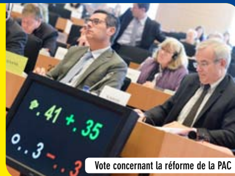
Vote concernant la réforme de la PAC

Les priorités du Parlement européen sont calquées sur celles du Conseil et de la Commission européenne. Les membres de la Commission de l'Agriculture et du Développement rural devront notamment se pencher sur la réforme des fruits et légumes ou sur la nouvelle réglementation de l'agriculture biologique. Les actualités internationale et européenne sollicitent également les députés que ce soit sur l'embargo russe ou sur les volets agricoles des négociations commerciales (Partenariat transatlantique de commerce et d'investissement, accord UE/Mercosur...). Concernant la Commission de l'Environnement, de la Santé publique et de la sécurité alimentaire, plusieurs sujets importants sont déjà inscrits à son agenda, parmi lesquels l'intégration des priorités environnementales dans