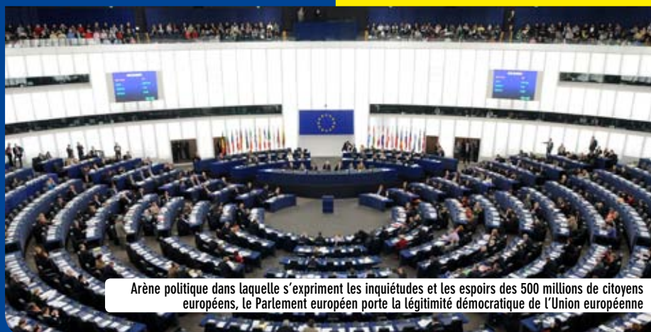
Arène politique dans laquelle s'expriment les inquiétudes et les espoirs des 500 millions de citoyens européens, le Parlement européen porte la légitimité démocratique de l'Union européenne