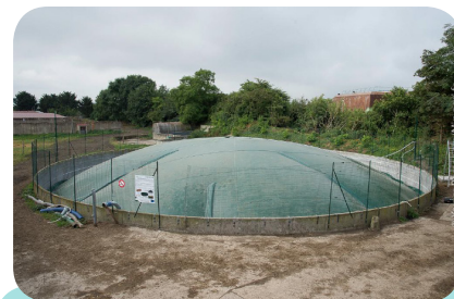
Couverture flottante récupérant le biogaz NENUFAR à la ferme Grignon Energie Positive (AgroParisTech)

Résultats : le projet doit démontrer si la solution est rentable économiquement et quantifier les réductions de méthane naturellement émis. Les premiers résultats seront disponibles fin 2016.